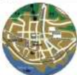
FOTO - VIDEO - DIGITAL